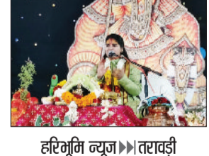
हरिभूमि न्यूज़ तरावड़ी