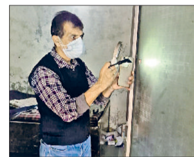
यमुनानगर के अमर विहार कॉलोनी में मुत मिले व्यक्ति के मामले में कार्रवाई करती पुलिस