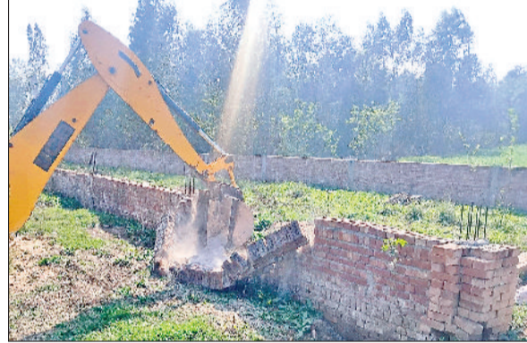
अंबाला। कॉलोनियों में हुए अवैध निर्माण को ढहाती जेसीबी।