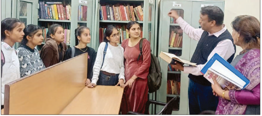
पानीपत। आईबी कॉलेज के विद्यार्थी लाइब्रेरी की गतिविधियों की जानकारी लेते हुए।