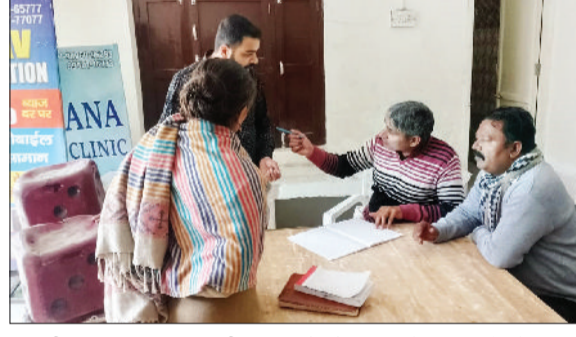
तरावड़ी। नगरपालिका कर्मचारी दुकानदारों को लिखित में सामान लौटाते हुए।

शहर में अतिक्रमण हटाने के लिए नगर पालिका तरावड़ी द्वारा चलाए जा रहे अभियान के तहत कल जव किए गए दुकानदारों के सामान को आज चालान काटने के बाद वापस लौटा दिया गया। नगर पालिका कार्यालय में दिनभर दुकानदारों की भीड़ लगी रही, जहां संबंधित दुकानदारों से जुमाना वसूल कर उनका सामान सुपुर्द किया गया। इस दौरान मार्केट एसोसिएशन के