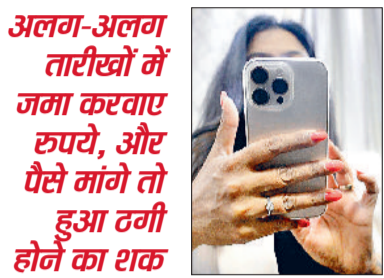
हरिभूमि न्यूज ▶▶ यमुनानगर