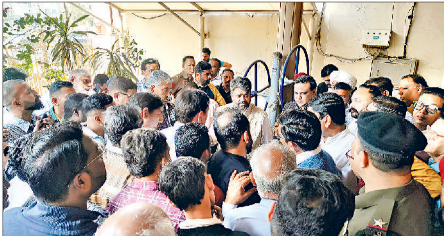
अंबाला। लोगों की समस्याएं सुनते पूर्व मंत्री असीम गोयल।

■ उन्होंने लोगों को आश्वस्त किया कि उनकी सभी समस्याओं का प्राथमिकता के आधार पर समाधान होगा।