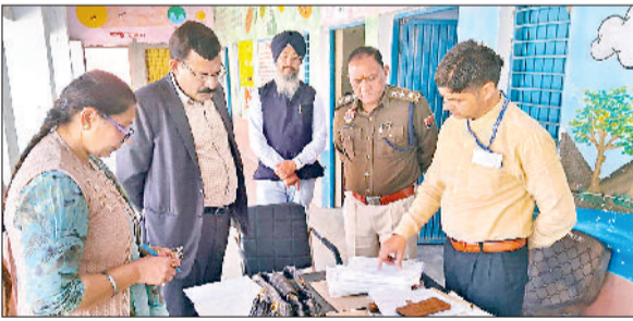
बराड़ा। परीक्षा केंद्र का निरीक्षण करते हुए अधिकारी।