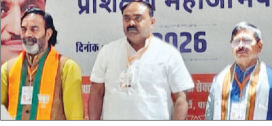
पानीपत। भाजपा की कार्यशाला में भाग लेते हुए पार्टी के वरिष्ठ पदाधिकारी।